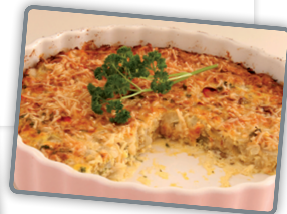
platte 9 beurs

Caroline over haar gerecht: de aardappelen kun je ook eventueel als puree erbij serveren. Eet smakelijk!