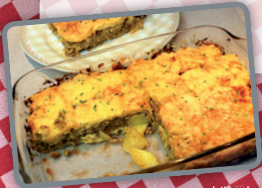
platte 10 beurs

Angela over haar gerecht: Deze maaltijd vult erg goed. Voor wat variatie kun je nog wat geraspte kaas over de schotel strooien voordat het de oven ingaat.