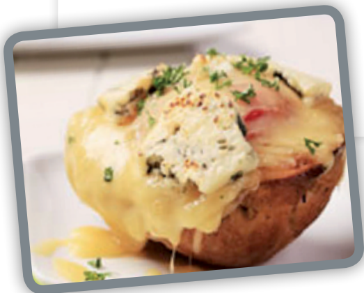
platte 8 beurs