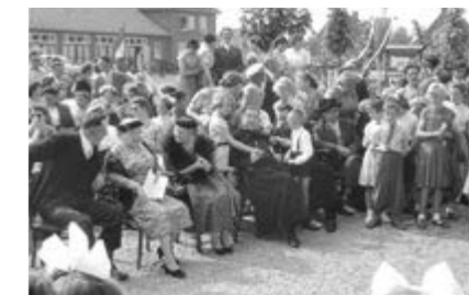
De in 1952 voltooide kerk van Maren-Kessel.