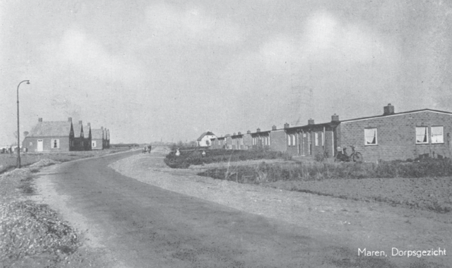
Een deel van de nieuwe dorpskern van Maren-Kessel. Links staan al zes nieuwe huurhuizen die in 1948 gebouwd werden door de aannemers Gebr. van Vugt in opdracht van de gemeente. Rechts in de verte de noodboerderij die zou uitgroeien tot het nieuwe dorpscafé met feestzaal. Op de voorgrond de noodwoningen; vijf blokken van twee. De buitenste blokken waren breder vanwege de extra kantoorruimte voor Boerenleenbank en postkantoor.