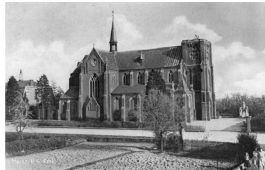
De gehavende kerk van Maren, een Ansicht uit 1948.

hevig verzet van de bevolking. Gelukkig maar, want tot op de dag van vandaag is Alem een hechte en bloeiende dorpsgemeenschap. Wel was er tot ieders spijt die gemeentelijke herindeling in 1958, die ervoor zorgde dat het dorp Alem alsnog Gelders werd. In de gesprekken over de herbouwplannen voor de kerken van Maren en Kessel werd geopperd om de beide parochies samen te voegen. Elk afzonderlijk waren ze eigenlijk te klein om zelfstandig te kunnen blijven, vonden men. Bijkomend voordeel zou zijn dat er dan ook maar één school en één voorziening op het gebied van medische verzorging nodig was. Mogelijk zou er zelfs nog een klein klooster of zusterhuis kunnen worden opgericht, om zich o.a. te bekommeren om de