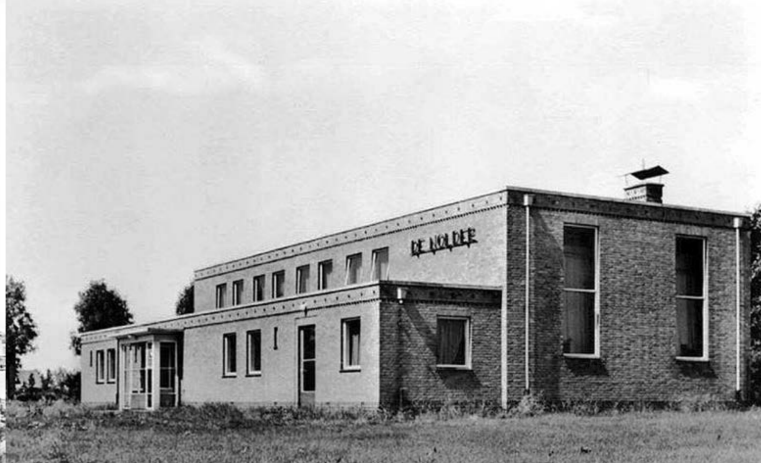
Het gemeenschapshuis werd in de zestiger jaren gebouwd. Met recht wat ze tegenwoordig een multifunctioneel centrum noemen: er kon gesport, vergaderd, gerepeteerd, gedanst, gestemd, herdacht en gefeest worden.