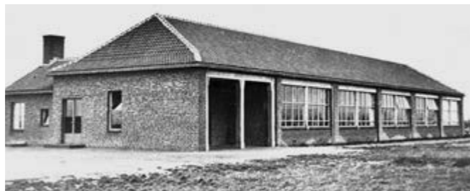
De nieuwe lagere school van Maren-Kessel in 1951.